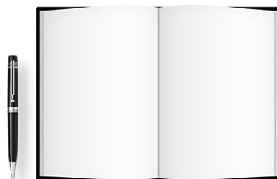
Penna e block-notes

Per farlo ti basterà un comune metro a nastro, una penna e un block-notes sul quale poter appuntare i valori.