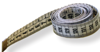
Metro a nastro

In questo documento illustriamo qual è il metodo per rilevare i valori in maniera tale da ottenere un preventivo di spesa attendibile.